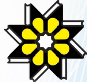
مرکز منقذهای اطلاع رسانی علوم و فناوری