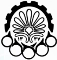
دانشگاه صنعتی امیرکبیر (پلی تکنیک تهران)